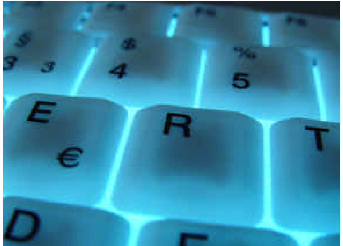
Ausspähern verhindern: URL-Rewriting sorgt für Sicherheit beim Benutzer und beugt Phishing-Attacken vor.

Der Referrer, der beim Einsatz des URL-Rewritings auch die SessionID enthält,